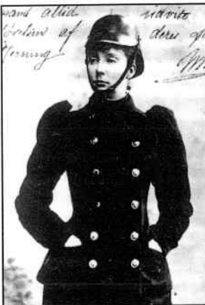
Princesse Marie d'Orléans - 1908 -